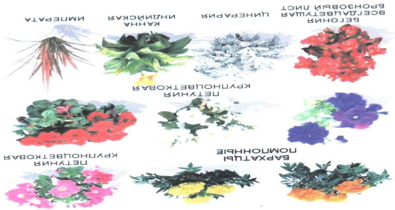
Ассортимент цветов используемых в цветнике