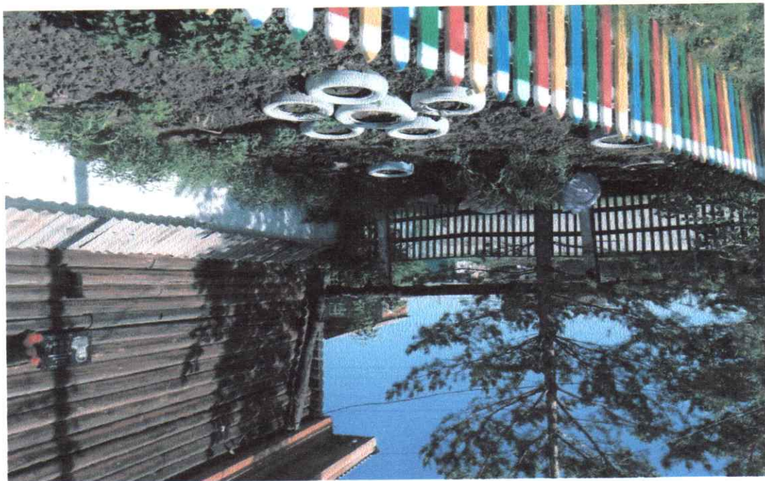
Вид цветника сейчас